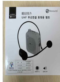
강의용 무선마이크 (신청시)